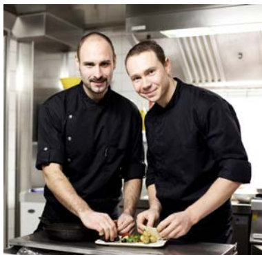
(von links nach rechts)